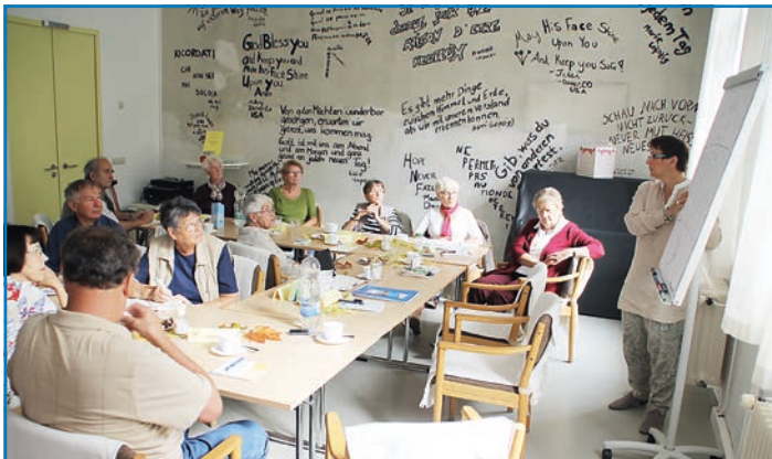
Die Selbsthilfegruppe Leipzig

Die Leipziger Selbsthilfegruppe von Betroffenen und Angehörigen mit Multiplem Myelom- Plasmozytom besteht das 7. Jahr und hat über 40 Mitglieder. Erkrankte und Angehörige aus ganz Sachsen, Sachsen-Anhalt, Thüringen, Berlin- Brandenburg, Vogtland bis zur Lausitz profitieren von der Arbeit der Gruppe.