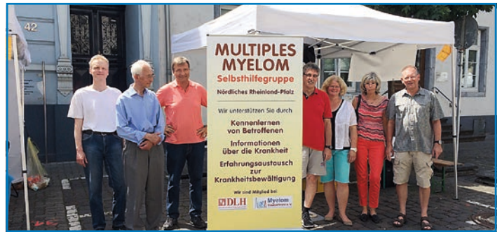
Unser Stand am Rheinland-Pfalz-Tag